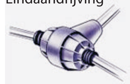
Differentieel en Eindaandrijving

Differentieelhuis met alle inwendige delen (Voor- achter- en vierwielaandrijving. Tenzij er sprake is van overdadige krachttinwerking , door bijvoorbeeld overbelading , langdurige te zware trekkrachten door bijvoorbeeld een te zware aanhangwagen indien er een aanhangwagen koppeling aanwezig is.