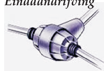
Differentieel en Eindaandrijving

Differentieelhuis met alle inwendige delen (Voor- achter- en vierwielaandrijving. Tenzij er sprake is van overdadige krachtinwerking, door bijvoorbeeld overbelading, langdurige te zware trekkrachten door bijvoorbeeld een te zware aanhangwagen indien er een aanhangwagen koppeling aanwezig is.